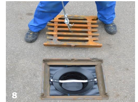
Die flexible coalsi® Dichtung passt sich an jeden Filterrahmen an