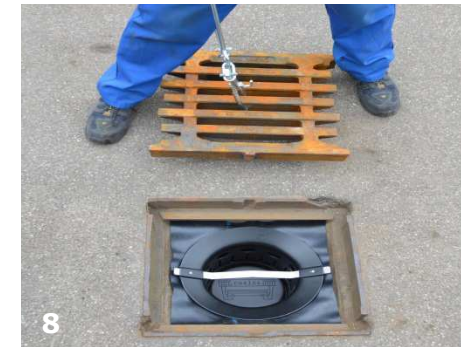
Die flexible coalsi® Dichtung passt sich an jeden Filterrahmen an